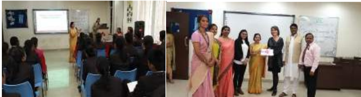
Felicitation of the speakers